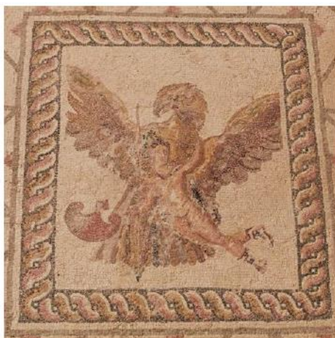
צילום: פסיס חטיפת גנימס, פאפוס