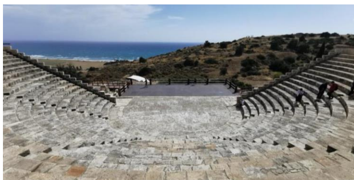
תיאטרון קוריון

היום האחרון של הסמינר של קפריסין היוונית – איה נאפה. נראה את המערות המרשימות סמוך לחוף הים, ונבקר בגן הלאומי של איה נאפה. נבקר באתריה השונים של איה נאפה הכוללים את המוזיאון העירוני, המנזר והמוזיאון הארכיאולוגי בו שוכנת סירה עתיקה שנמשתה מהמצולות. בערב נגיע לשדה התעופה ונטוס לנתב"ג.