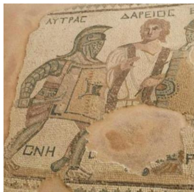
פסיפס הגלדיאטורים, פאפוס.

עם בוקר נסע מערבה אל פאפוס – עיר זו הגיעה לגדולה בתקופה ההלניסטית והרומית. נבקר במוזיאון הארכיאולוגי של פאפוס אשר נחנך לאחרונה. לאחר מכן נסייר בחלק העתיק של פאפוס (פלאו-פאפוס) בו שכן בעבר מקדש קדום לאלה אפרודיטה. משם נסע אל "קברי המלכים" – נקרופוליס של קברים מרשימים בו נקברו עשירי פאפוס בתקופה ההלניסטית. את הפסקת הצוהריים נקיים בנמל העתיק שבו גם שוכנת מצודה מימי הביניים. לאחר מכן נבקר באתר הפסיפסים המפורסם של פאפוס הכולל רצפות פסיפס מרשימות מהתקופה הרומית, בהן מוצגים סיפורים ודמויות מוכרות מהמיתולוגיה היוונית. נשוב למלון בלימסול ולאחר מנוחה קצרה נסעד ארוחת ערב במסעדה.