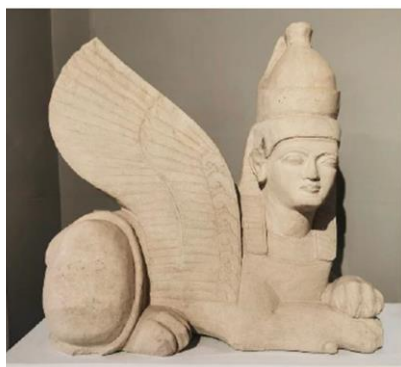
ספינקס תמסוס, מוזיאון ניקוסיה.

עם בוקר נסע צפונה לכיוון ניקוסיה ובדרך נבקר באתר אידליון – אתר ארכיאולוגי מרתק שבעבר התקיימה בו אחת ערי-המדינה של תקופת הברונזה באי. נמשיך אל ניקוסיה, בירת קפריסין, ונראה את המוסדות החשובים של העיר ובהם: ארמון הארכיבישוף והקתדרלה. נערוך סיור במוזיאון הארכיאולוגי הלאומי של ניקוסיה ונראה את הממצאים המרשימים שבין כתליו. בהמשך נבקר בעיר העתיקה של ניקוסיה המתוחמת בחומות ונציאניות ונצעד בסמטאות העיר. בערב נשוב למלון בלימסול.