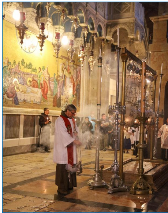
נזיר פרנציסקני בכנסיית הקבר.

בשנת 1342 קיבלו נזירי המסדר הפרנציסקני בולה אפיפיורית, אשר מינתה אותם לשמור על המקומות הקדושים בארץ הקודש. בסיור נכיר את המסדר הפרנציסקני ואת האתרים בעיר העתיקה שבבעלות המשמורת הפרנציסקנית של ארץ הקודש ("קוסטודיה טרה סנטה"). נכנס לרובע הנוצרי דרך "השער החדש" אל מנזר סן סלבדור, שם נפגוש נזיר פרנציסקני ונשמע ממנו על המסדר ועל פעילותו. נסייר ברחבי המתחם ובכנסייה הגדולה שבתחומו, אשר משרתת את הנזירים הפרנציסקנים ואת הקהילה המקומית דוברת הערבית. לאחר מכן נבקר ב"דאר אל-קונסול", מתחם פרנציסקני שנפתח לאחרונה לביקורי קהל לאחר חפירה ארכיאולוגית אשר חשפה ממצאים חדשים ומרתקים. במקום היה בעבר מעונו של הקונסול הפרוסי בירושלים, ומכאן שמו. בהמשך נצעד ברחוב הווייה דולרוזה, הלוא היא דרך הייסורים של ישוע, ונשמע על תרומתו ההיסטורית של המסדר הפרנציסקני להתפתחות הדרך. נבקר במוזיאון הפרנציסקני שבתחנת ההלקאה. לאחרונה נפתחו מחדש חלקים מהמוזיאון ובהם מוצגים ממצאים ארכיאולוגיים מרתקים מהחפירות שניהלו הנזירים הפרנציסקנים באתרים שהופקדו בידם.