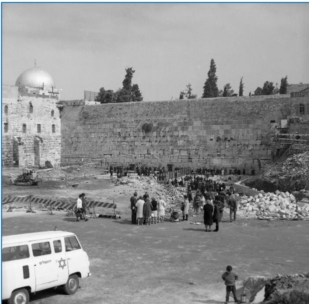
עבודות להכשרת רחבת הכותל המערבי.