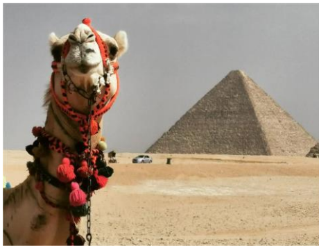
הפירמידה הגדולה של גיזה