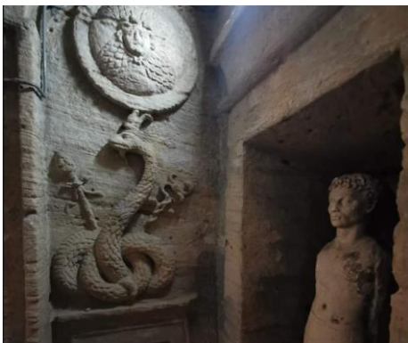
קטקומבות אלכסנדריה, צילום: שחר גופר

נצא בשעות הצהריים בטיסה לקהיר ומשם נסע לאלכסנדריה. אלכסנדריה הוקמה על ידי אלכסנדר מוקדון במאה ה-4 לפנה"ס ונקראה על שמו. העיר שימשה כבירתם של מלכי בית תלמי, יורשיו של אלכסנדר, אשר הקימו בה מונומנטים היסטוריים חשובים כמו המגדלור והספרייה של אלכסנדריה. עם הגיענו לעיר נבקר בטיילת "הקורניש" הנושקת לים התיכון ונדרשם מהמפרץ ששימש כנמל בתקופה ההלניסטית. נפתח את המסע בארוחת ערב במעסדת דגים מקומית. לינה במלון Steigenberger Cecil, אלכסנדריה.