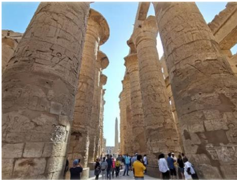
מקדש כרנך