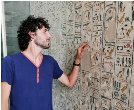
הפירמידה הגדולה של גיזה