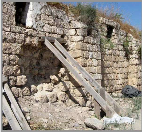
מצב קיים: דופן הקיר והליבה נהרסו, חלקי תמיכות עץ נגנבו.