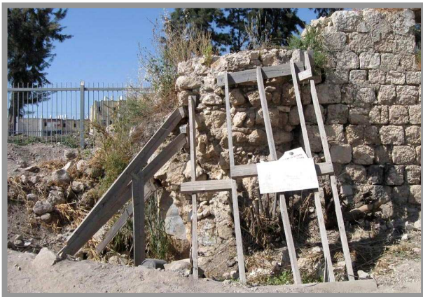
פינה דרום מערבית. איזור תמיכה על ידי שקי

1. באגף הצפוני בקיר החזית הפונה לחצר, קיים איזור בו הדופן החיצונית וליבת הדבש של הקיר נהרסו. בעבודות ההצלה בשנת 2007 הורכבו תמיכות עץ זמניות במקום. עם הזמן חלקי התמיכות נגנבו, המצב הפך ליציב חלקית, במידה וייגנבו חלקי תמיכות נוספים המצב יהיה מסוכן. המלצות: שחזור הדופן החיצונית וליבת הדבש של הקיר.