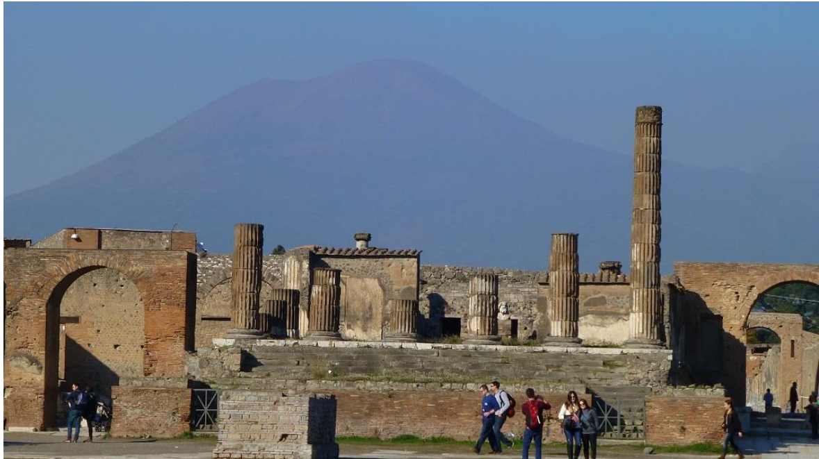
מקדש יופיטר המצילום