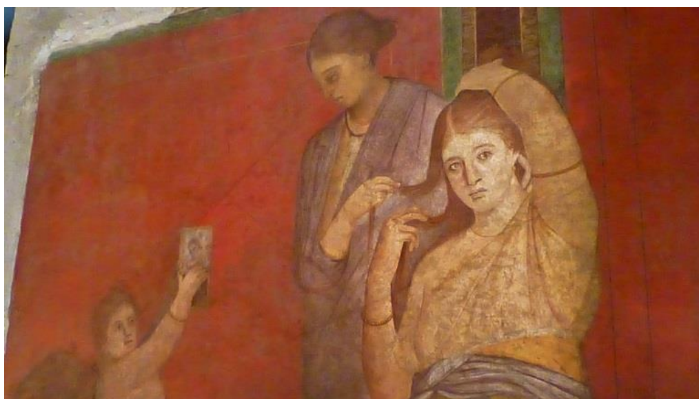
בית המיסטריות – דיוניסוס הנערץ על הנשים

8X זהו ווילה גדולה ומפוארת אשר באגף הימני החזיתי שלה ישנו אולם שמידותיו כ-5 מטרים. על קירות האולם ציורי קיר מרשימים המתארים את המיסטריות, טקסי החניכה של הבנות המתבגרות המיועדות לשמש בפולחן. הסצנות השונות מתוארות כסרט נע המתחיל משמאל לפתח האולם וסובב אותו עד לצדו השני של הפתח