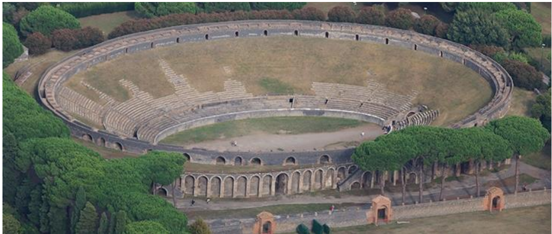
תצלום אוויר של האמפי-תיאטרון ומשמאלו הגימנסיום

שלמה ארצי מעולם לא הופיע באמפיתיאטרון של קיסריה מופתעים? למרות שכלי התקשורת מרבים לדווח לנו על הופעות באמפיתיאטרון של קיסריה, הם מתכוונים לתיאטרון של קיסריה. מתקני השעשועים הרומיים היו רבים ומגוונים, אך לכול אחד מהם היה מראה משלו וייעוד משלו. בעוד שהתיאטרון הוא מבנה חצי עגול (כמו התיאטרון של קיסריה בו שלמה ארצי מופיע), האמפיתיאטרון הוא מתקן סגלגל. התיאטרון שימש להצגות; דרמה, טרגדיה, קומדיה וסטירה, כול אלה נתפסו מאז התקופה היוונית כחלק מפולחן האל דיוניסוס. האמפיתיאטרון שימש למאבקי אדם בחיות טרף והוא היה תרומה מפוקפקת של הרומים לתרבות הקלאסית. הגלדיאטורים שנלחמו בחיות היו לעיתים אנשי מקצוע מיומנים ולעיתים עבדים שציפו לקבל את חירותם אם יצליחו לגבור על חיית הטרף. יהודים ונוצרים רבים הושלכו לזירות האמפיתיאטרון ומצאו שם את מותם להנאת הקהל צמא הדם ולכן היהדות והנצרות פתחו טינה להווי של המתקנים הללו ומיד לאחר שהנצרות הפכה דומיננטית הופסק השימוש באמפיתיאטרון.