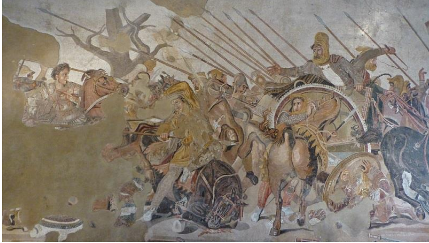
הפסיפס של אלכסנדר בבית פאון

זהו הבית הגדול ביותר בעיר ובעליו היה ללא ספק אחד מנכבדי העיר. הבית קרוי על שם האל פאון ופסל ברונזה של האל הוצב בכניסה המונומנטאלית לבניין. כיום נמצא שם עותק של הפסל המקורי הממתין לכם במוזיאון הארכיאולוגי של נאפולי. גולת הכותרת בבית אשר נוסד כבר במאה השנייה לפסה"נ היא ללא ספק רצפת הפסיפס המציגה את אלכסנדר הגדול זוהי אחת היצירות המפורסמות באומנות ההלניסטית – רומית. Issos המנצח בקרב איסוס. באתר מוצג עותק מרשים של הפסיפס המקורי שגם הוא במוזיאון של נאפולי.