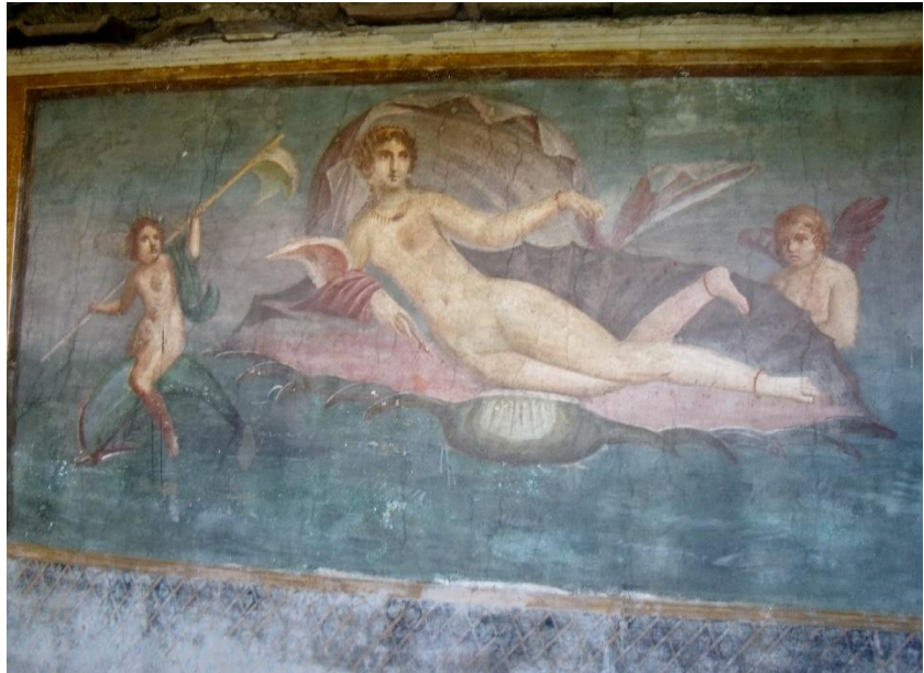
ציור הקיר של ונוס על הצדף

הבית מאפשר לנו הזדמנות אחת מרבות להתרשם ממבנה הווילה הרומית הטיפוסית. הווילה הייתה מאורגנת כמערך חדרים המקיף חצר פנימית קטורה, מוקפת עמודים. גגות הסטווים שסביב החצר היו נטויים למרכזה של החצר ומי הגשמים הוסטו לבור מים בלבה של החצר ממנו נשאבו מים לשימוש דיירי הבית. יש לזכור שתושבי החלק הזה של האימפריה, נהנו משניים-עשר חודשי גשם בשנה, כך שהספקת המים שלהם הייתה סדירה וזאת בניגוד לתושבים הלונטיניים של האימפריה אשר נאלצו לחיות באזורים צחיחים יותר כדוגמת ארץ-ישראל, שם אגירת המים הייתה משימה מורכבת יותר. לווילות המרווחות יותר בפומפי היו גנים פרטיים. בחלקו הדרומי של הווילה הזו תוכלו לצפות בציור קיר מרשים המציג את ונוס בתוך חלון מדומה הפונה אל הים. ונוס מתוארת בתוך צדף ומלאכים ניצבים לצדה