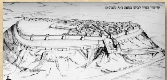
שחזור תל לכיש ובמרכזו הארמון

בוני ארמון המצודה בלכיש בחרו במיקום הגבוה ביותר בעיר להקמתו, אך לא ברור מדוע הם בחרו למקם אותו באוריינטציה צפון-מזרחית בעוד שהמתחם המבוצר של העיר היה בעל מתאר רגולארי יחסית ובאוריינטציה צפונית-מערבית. הארמון ניבנה על בסיס במה מוגבהת, או פודיום, אשר נתמך על בסיס קירות שיצרו מעין ארגזים אותם מילאו עד לגובה הרצפה. סביב במת הארמון, לאורך שתיים או שלוש מפאותיו, התקינו בוניו סוללת תמך שצופתה בטיח. לצורך מילוי הבמה והתקנת הסוללות נדרשו כ-10,000 קוב של חומרי מילוי אשר