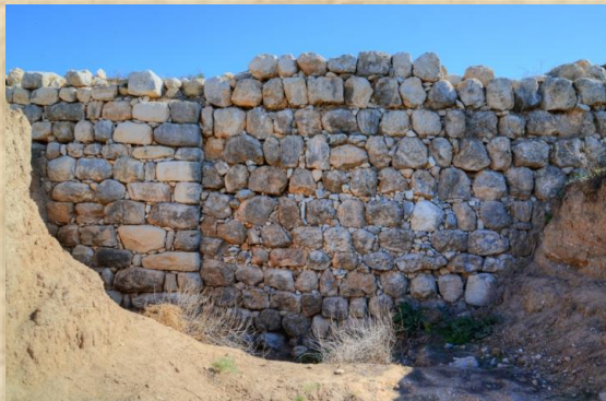
התפר בין פודיום A לפודיום B (מבט לכיוון מזרח)

בתקופה מאוחרת יחסית, כנראה במאה ה-8 לפסה"נ, בעת שממלכת יהודה הלכה והתעצמה, תושביה רבו וכלכלתה פרוחה, הוחלט להרחיב את הארמון ולשנות את תכניתו. בצד המזרחי של במות A ו-B, נבנה קיר מסיבי ברוחב 3.40 מ' אשר זכה לכינוי פודיום C על ידי החופרים הבריטים של האתר. בשלב הזה שלושת הפודיה 1 יצרו במה גדולה