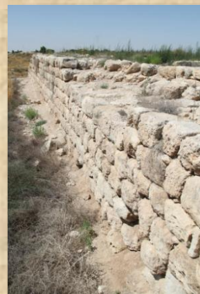
הקיר המזרחי של פודיום הארמון

הארמון וכל העיר לכיש עברו חורבן אלים בעת הכיבוש האשורי. יש להניח שכבר שזמן הכיבוש לא נותרו בו שרידים רבים. על גבי הארמון של מלכי יהודה נבנה ארמון מאוחר יותר, בתקופה הפרסית, ולפיכך לא עלה בידי הארכיאולוגים לחשוף ממצאים שימחישו את חיי היום-יום של אצולת ממלכת יהודה אשר שכנה בארמון.