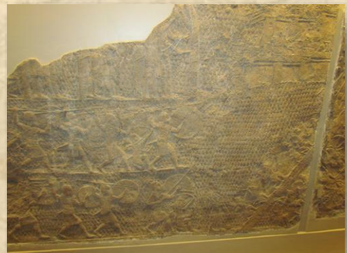
תבליט מארמון נינוה המציג את המצור האשורי על לכיש – המוזיאון הבריטי

המבקרים בתל לכיש זוכים לתצפית מרשימה מאוד מהבימה המוגבהת עליה ניצב ארמון עיר המבצר של לכיש. אך כיום אנו ניצבים על מפלס הרצפות של הארמון והתצפית מגנתו הייתה מרשימה עוד יותר והיא סיפקה למי שזכה לבקר בארמון מבט על חלקים נרחבים ממישור חוף פלשת, משפלת