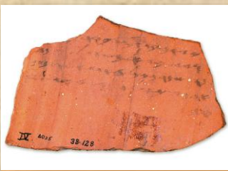
מכתב IV מלכיש