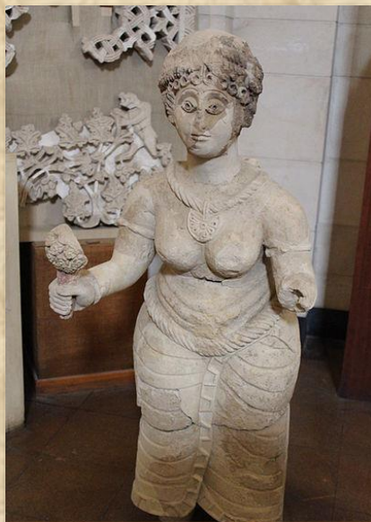
דמות אישה מכווירת בגבס – מוזיאון רוקפלר

ההשפעה של האמנות הפרסית הסאסאנית באה לידי ביטוי בין היתר גם בשימוש בעיטורים של שושן בעל שישה עלי כותרת ובפרחי לוטוס. אך כאמור הארמון התאפיין גם בהשפעה מערבית, רומית-ביזנטית, למשל בתכניתו הכללית כמכלול רבוע ובמרכזו חצר פריסטילית, מוקפת עמודים ובפינותיו מגדלים עגולים. תכנית זו דומה להפליא למצודות הלימס שנבנו על ידי הרומים על גבול האימפריה והיו מוכרים היטב לתושבים המרחב הערבים. ההשפעה המערבית באה לידי ביטוי גם בעיצוב בית המרחץ ושימוש הרב בפסיפסים מעוטרים ורב-גוניים, בציורי קיר עשירים, בשימוש במוטיב עלי האקנטוס בכותרות הדמוי קורינתיות על גבי העמודים ועוד.