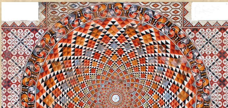
קטע מהפסיפס המרכזי בבית המרחץ – מיצירות הפסיפס המרהיבות בעולם העתיק

נבנה מעל המכלול והוא סייע לשמירה על הטמפרטורה הנמוכה בתחומו. מאחורי ספסל שהוצב בסירבאד הייתה שוקת צרה וארוכה אליה זרמו מים צוננים שנועדו להנעים את שהיית האנשים. החדר המרכזי באגף הדרומי כלל מסגד קטן [7] ובדרומו נבנתה גומחת המיחרב. מסגד נוסף, רחב ממדים, הוקם באגף הצפוני-מזרחי של הארמון [8]. באגף הצפוני-מערבי נבנה בית מרחץ [9] מהודר על כל האגפים שהיו מקובלים בבתי המרחץ הרומיים. בית המרחץ היה רחב ממדים והוא נתמך ב-16