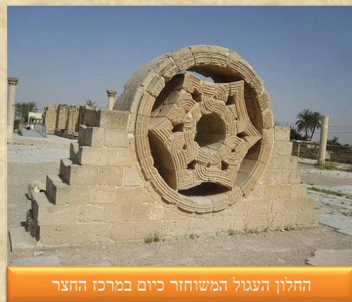
החלון העגול המשוחזר כיום במרכז החצר

אומנות שהיו סדורות בארבע שורות. בראשו הוקמה כיפה. ה'תוף' שנשא את הכיפה היה מוקף בגומחות מעוצבות אשר בתוכן הוצבו פסלי נשים חשופות חזה. שער הכניסה לבית המרחץ היה מעוטר בעושר רב ומעליו נבנתה נישה בה הוצג פסל השליט, אשר נמצא בחפירות ללא ראשו. באכסדרה המערבית של בית המרחץ נמצא פסיפס צבעוני מרהיב שעוצב בדגם של זנב טווס. מרבית רצפות בית המרחץ כוסו בפסיפסים גיאומטריים מהודרים שבוצעו על פי מיטב המורשת הביזנטית ואולי אף על ידי אנשי מקצוע נוצריים אשר הותירו כתובות גרפיטי באתר. מצפון-מערב לבית המרחץ הוקם חדר קבלת אורחים [10] אשר היה מרוצף במלואו בפסיפסים מרהיבים, אף שהם לא כללו דמויות אדם. הגומחה החצי עגולה של החדר עוטרה בפסיפס מרהיב בדמות עץ אשר משני צדיו דמויות בעלי חיים על פי מיטב מסורות האמנות הרומיות. בראש הכיפה שניצבה מעל החדר הוצב תבליט דמוי פרח אקנטוס ובין ששת עלי הכותרת של האקנטוס שובצו תבליטי ראשי נשים וגברים. סביב התבליט עוצבה רצועה בדגמי עלי גפן. אמת מים שהגיעה מהמעיינות ממערב לארמון סיפקה מים לבית המרחץ ולארמון כולו.