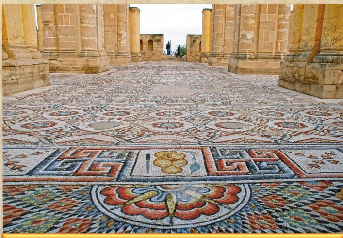
רצפת הפסיפס המפוארת ורחבת הממדים בבית המרחץ ואומנות בית המרחץ אשר בפינות כל אומנה ארבע עמודים אחוזים