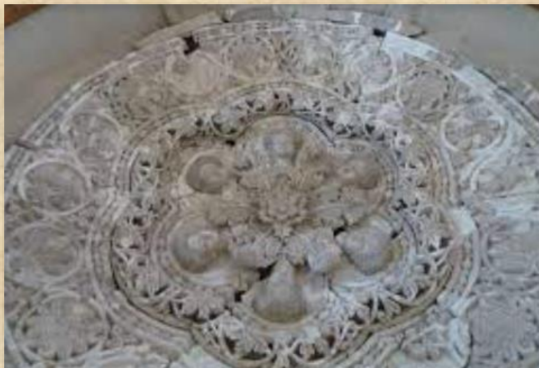
כיפת הדמויות המכווירות בגבס – מוזיאון רוקפלר

ארמון הישואם מייצג שלב מרתק באבולוציה של התרבות המוסלמית. מצד אחד הוא מציג אליטה שבמהלך דורות אחדים עשתה מהלך משמעותי מתרבות נוודית מדברית לתרבות יושבי קבע עשירה ומפוארת. מנגד הארמון מציג מזיגה של השפעות מהמרחב הפרסי ממזרח והרומי-ביזנטי ממערב, כאשר המיזוג היה לעיתים מאולץ. ומעל הכל, ניכר הרצון של בעלי הארמון להותיר רושם רב על מבקריו בהתאם לערכים שאפיינו את הממלכות שקדמו להם ומנגד ישנם אגפים בארמון שאולי מרמזים על הנטייה של המוסלמים להימנע מעיסוק באמנות פיגורטיבית.